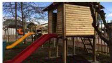
CESFAM SAGRADA FAMILIA