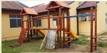
CESFAM VILLA PRAT