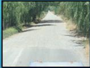
K-180 San Juan Los Quillayes