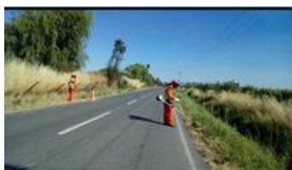
K-158 La Higuera