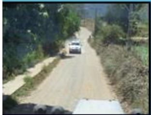
SJ-98 Santa Emilia Interior