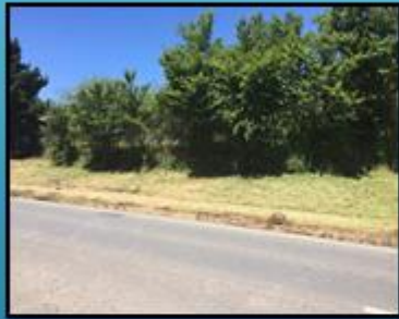
Cruce Ruta 5 – Villa Prat – Cruce K-60.