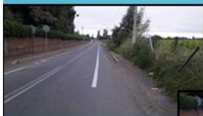
K-110 Lo Valdivia