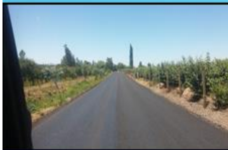
K-158 La Higuera