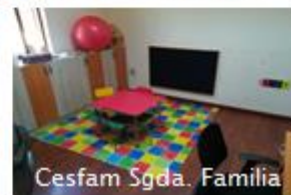
Cesfam Sgda. Familia