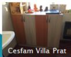
Cesfam Villa Prat

A través de este fondo se mejoraron las salas de estimulación de los CESFAM y Postas Rurales de la comuna, implementando mobiliario necesario para la correcta atención de los usuarios