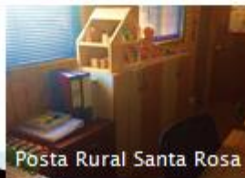
Posta Rural Santa Rosa