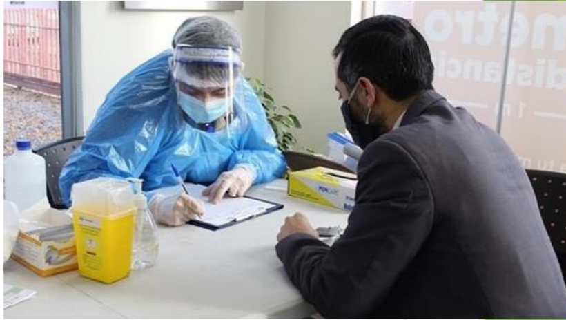
Aplicación de Test rápidos Covid - 19 y Educación en Panadería Flor de Asturias Sagrada Familia